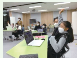
학생·학부모 에듀테크 체험프로그램