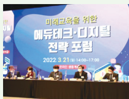
에듀테크 활용 성과공유